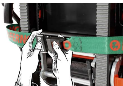
Fastgør stolen med fastholdelsesordningen (figur 6).